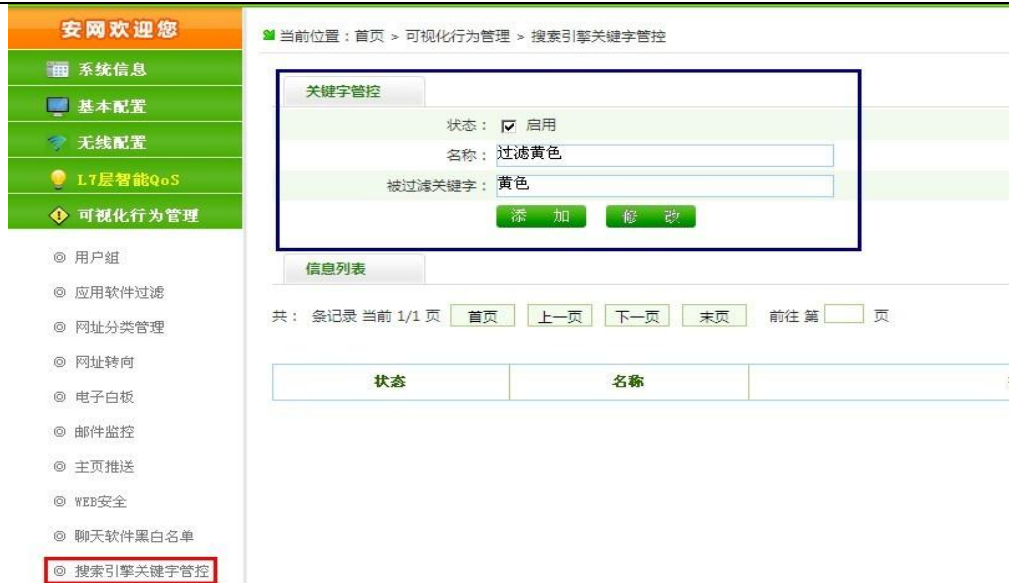
搜索引擎关键字过滤