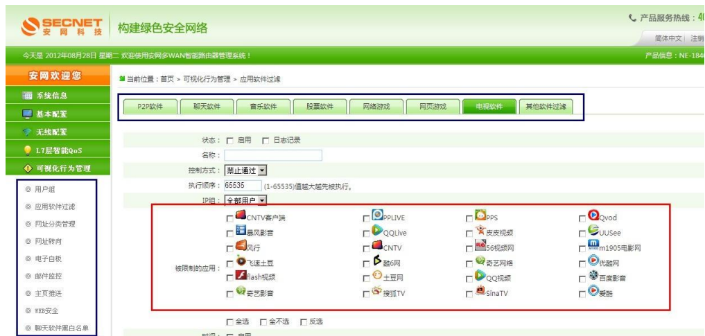
可视化行为管理图析

网站分类： 对各种类型网址进行分类管理，指定用户在指定时间内访问指定网站，网址黑白名单让员工在上班时间只能访问工作相关网站，提高工作效率的同时避免中毒概率。