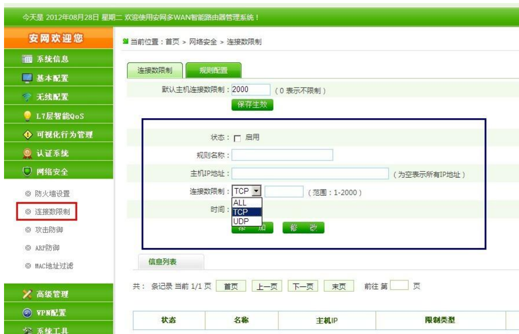
连接数分协议限制