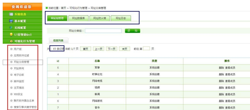
聊天软件黑白名单图析

聊天软件高级管理： 让企业上班指定的客服 QQ、企业 QQ、MSN、飞信号码才能登陆。